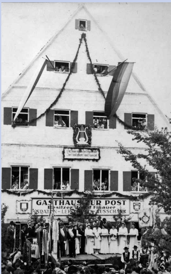
Feier 300 Jahre Alte Post 1950