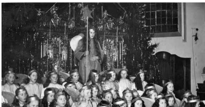
Christmette ca. 1950